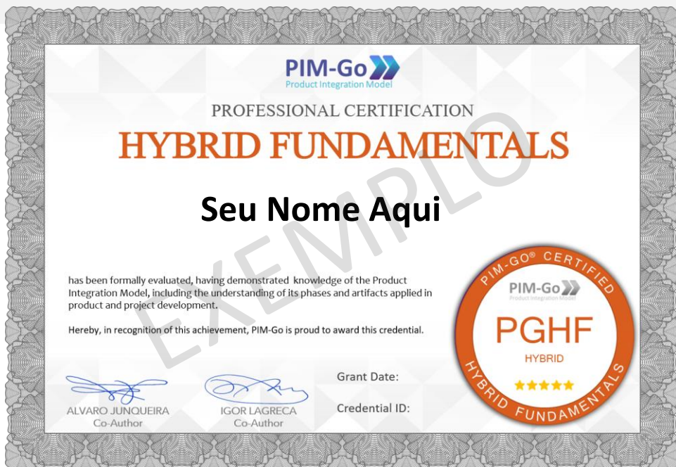
Ilustração da certificação

É expressamente vedada a reprodução, total ou parcial, do conteúdo do Exame, bem como sua execução em formato que não seja estritamente individual.