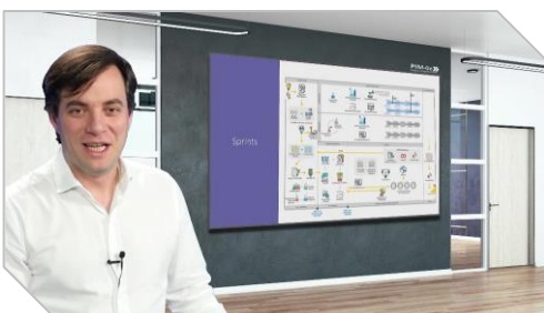
Imagens do curso

O PIM-Go disponibiliza um pacote do curso PIM-Go Foundations + Certificação com preço diferenciado.